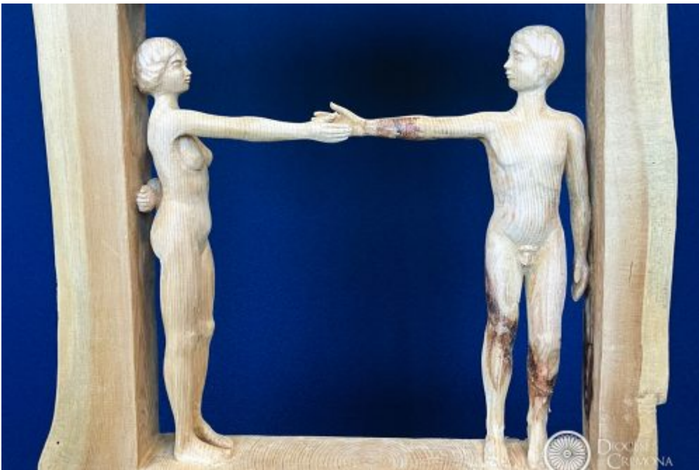
Homepage 2, Iniziative culturali “Leggersi con le mani”: dal 15 novembre, le sculture di Sergio Lotta in mostra a Santa Monica