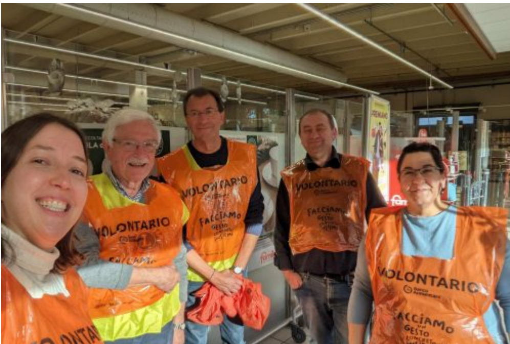
Dalle associazioni, Homepage 2 Colletta Alimentare, incontro di presentazione al Teatro Monteverdi con due testimonianze di dono