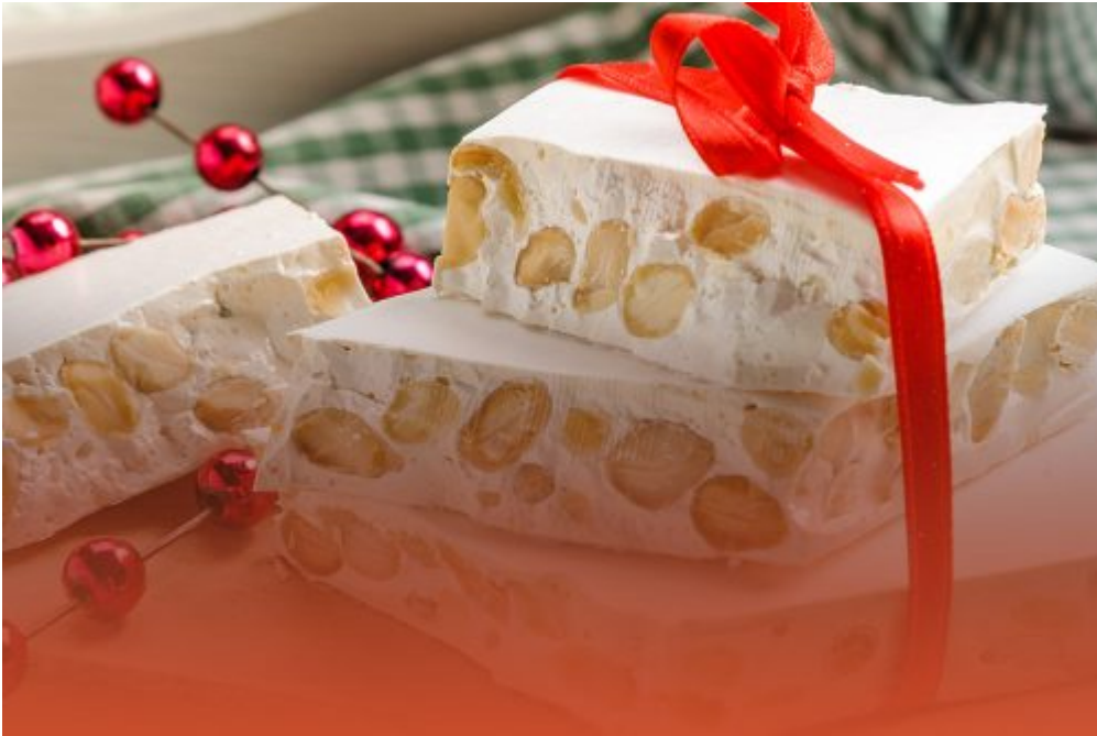
Dal Territorio, Homepage 2 “Un Natale di Pace”: stecche di torrone per sostenere il progetto di ortoterapia della Fondazione La Pace