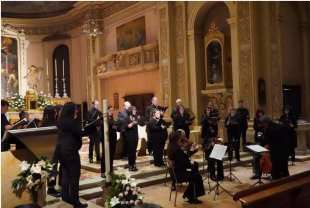
Dalle parrocchie, Homepage 2 Terzo concerto della rassegna organistica castelverdese domenica a San martino in Beliseto in occasione della festa patronale