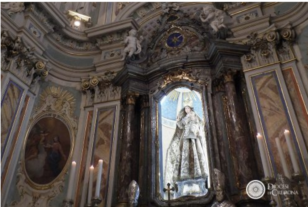
Dalle parrocchie, Homepage 2 Antegnate, festa dell'Apparizione con la raccolta di stoffe per un nuovo mantello della Vergine