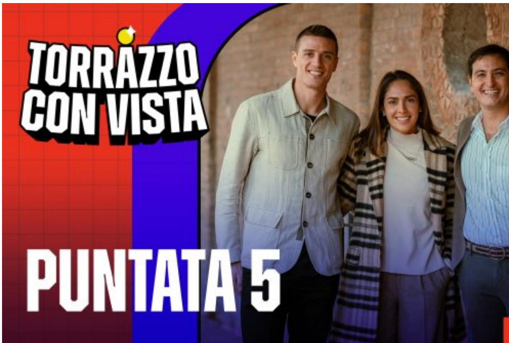
Homepage 2, podcast