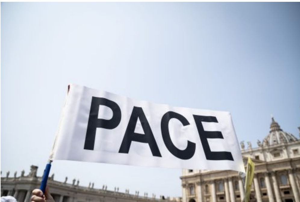
Dalle associazioni, Homepage 2 No alla guerra. I presidenti e i responsabili delle Associazioni cattoliche: «Con il Papa diciamo basta, prima che sia troppo tardi»