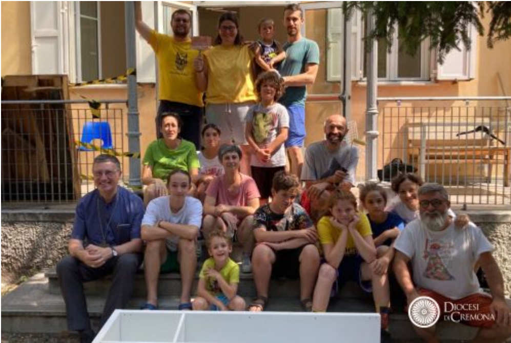
Diocesane, Homepage 2 #cosebelle24, con Drum Bun e Caritas la vacanza di giovani e famiglie a Trieste nel segno del servizio