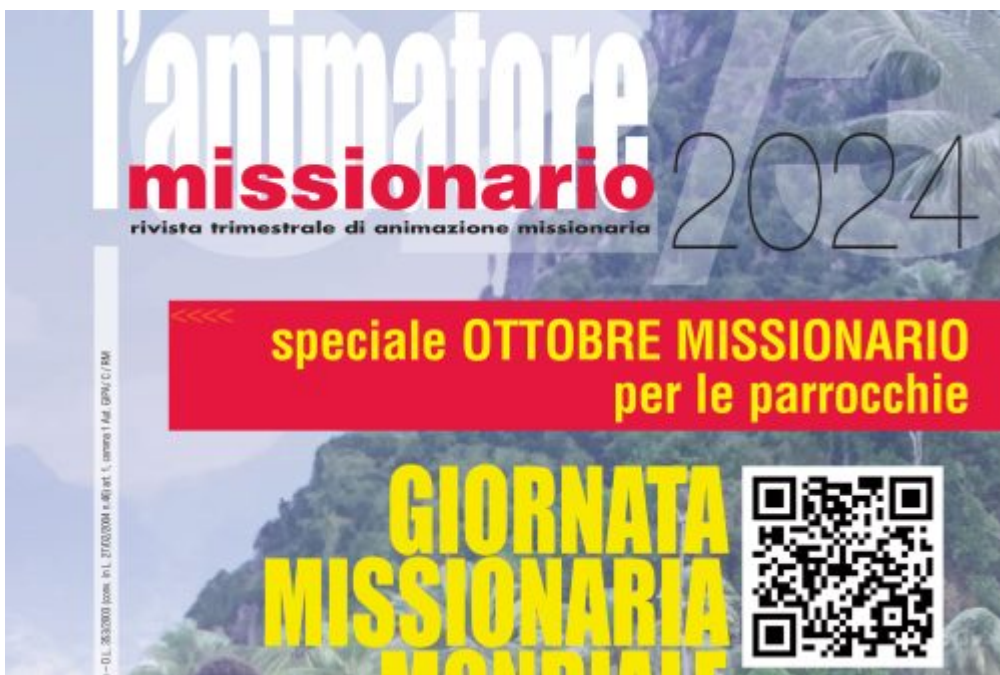
Homepage 2, La vita della Chiesa