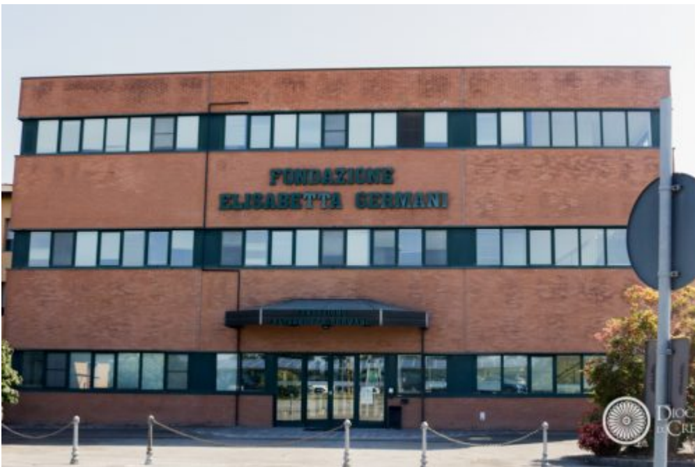
Dal Territorio, Homepage 2 Alzheimer, accanto ai malati e a chi li assiste. Convegno alla Fondazione Germani