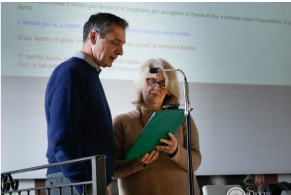
Diocesane, Homepage 2 Una Pastorale familiare «felice di ogni piccolo passo compiuto»