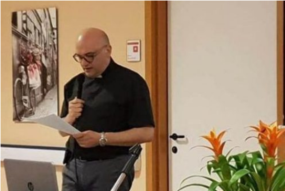
Diocesane, Homepage 2 Pastorale della salute, un nuovo anno con l'attenzione rivolta alle fragilità