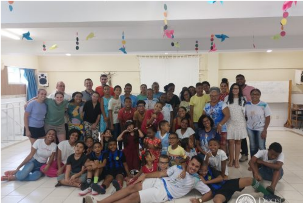
Dalle Missioni, Homepage 2 Brasile, a Salvador de Bahia un nuovo gruppo di volontari