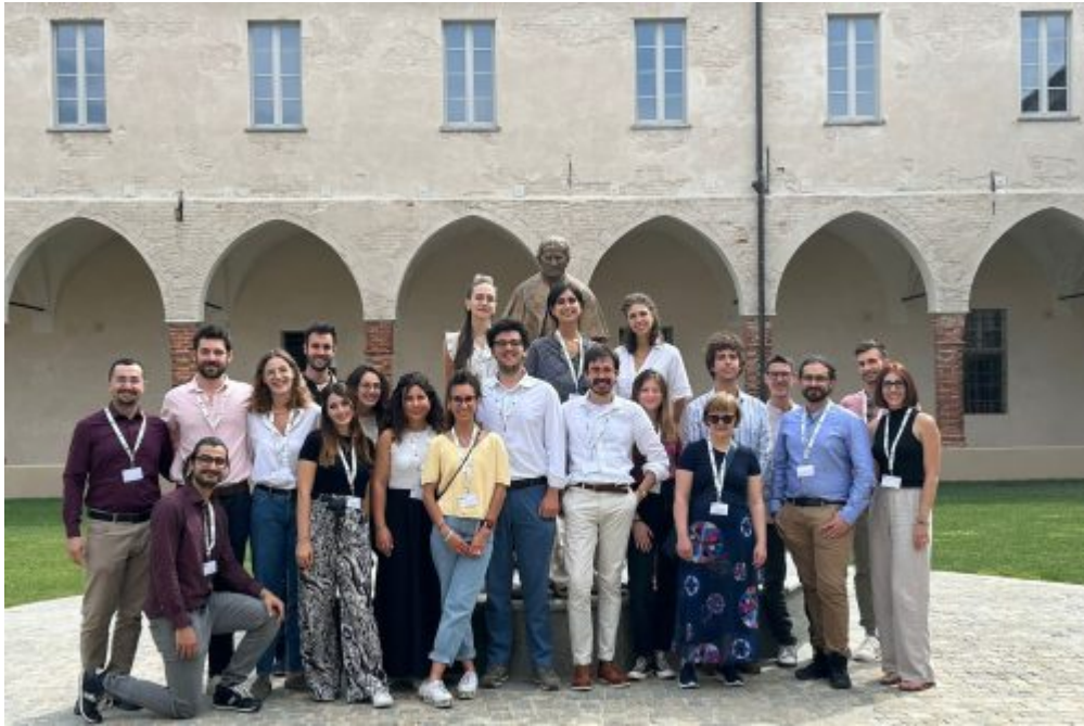
Dal Territorio, Homepage 2 Comunicare e finanziare la ricerca: la summer school che dà valore alla scienza