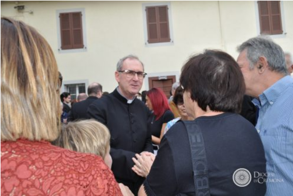
Dalle parrocchie, Homepage 2