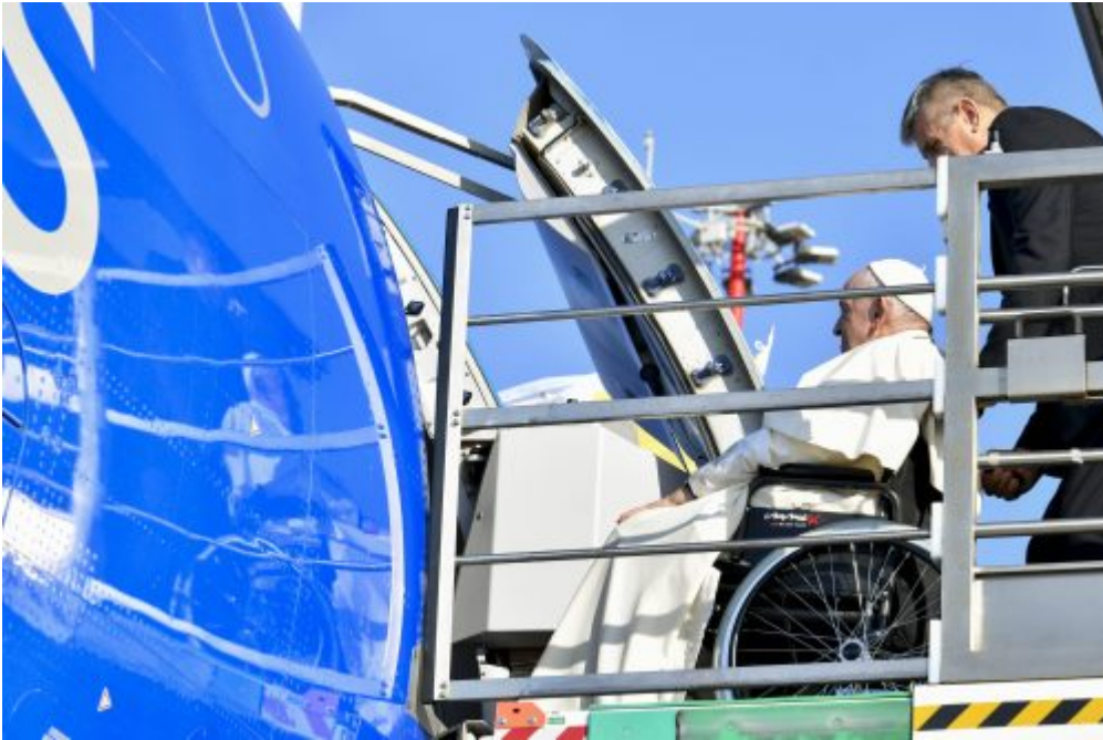
Homepage 2, La vita della Chiesa Il Papa in Lussemburgo e Bruxelles