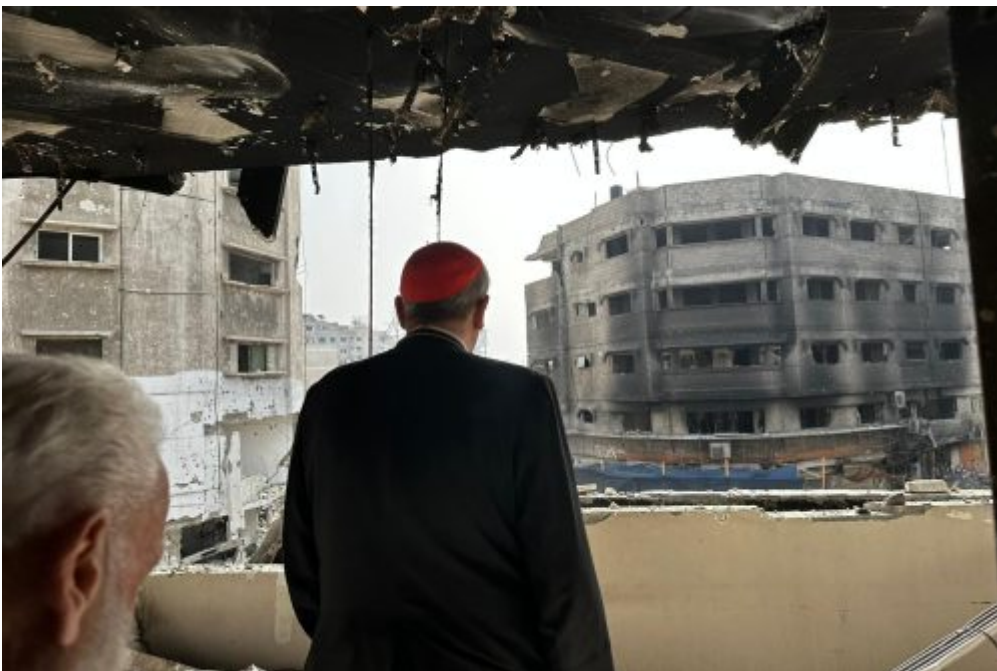
Homepage 2, La vita della Chiesa Patriarcato latino, 7 ottobre Giornata di preghiera, digiuno e penitenza per la pace