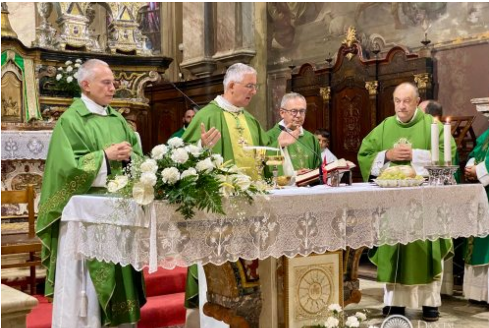
Dalle parrocchie, Homepage 2