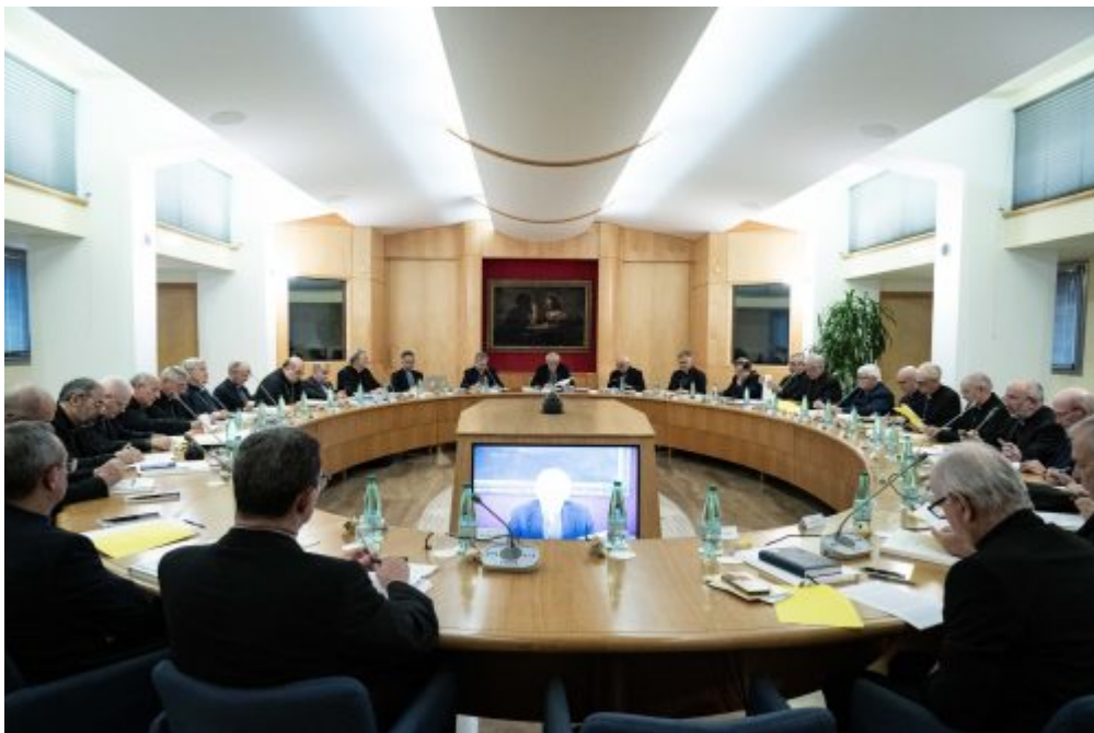
Homepage 2, La vita della Chiesa CEI, il comunicato finale del Consiglio Episcopale Permanente