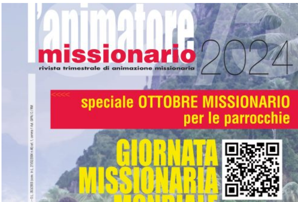
Homepage 2, La vita della Chiesa